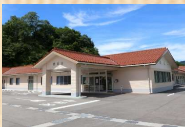
障がい者支援施設 愛香園