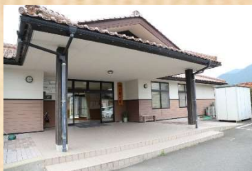
四ツ葉の里地域支援センター