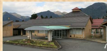
障がい者支援施設 くるみ邑美園