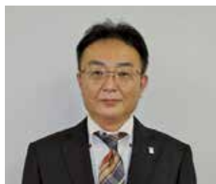
土 佐 斉

く る み 邑 美 園…施設長 く る み 邑 美 園 児 童 部 …施設長 放 課 後 デ イ み ん と …所 長