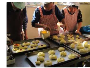
パンの製造・販売