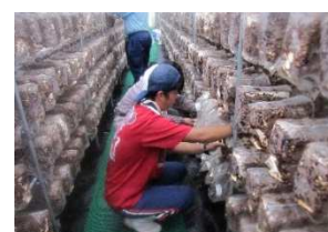
菌床椎茸の栽培・管理