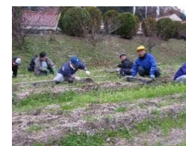
玉ねぎ苗の抜き取り