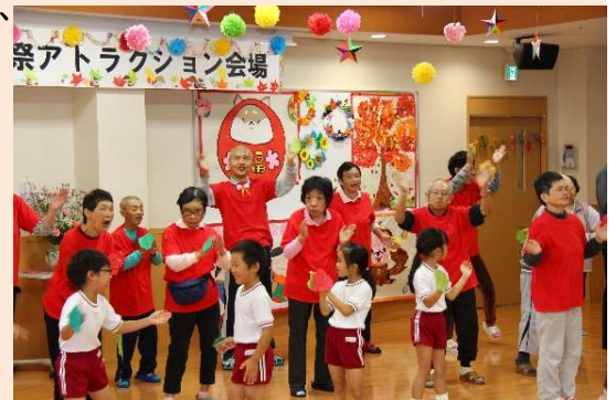
👉 東保育所の皆さんと愛香園利用者さんによるダンス