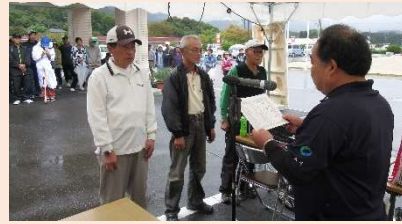
👉 グラウンド・ゴルフ表彰式

10月19日(土)、小雨が降る中ではありましたが、無事に愛香祭を開催することができました。今年で9回目を迎えたグラウンド・ゴルフ大会は、地域の方々に多数ご参加いただき、また利用者さんも数名参加し、和やかな雰囲気の中で行うことができました。コート内では、ホールインワンが出る度に大きな歓声も上がり、楽しんでいただいている様子うかがえました。