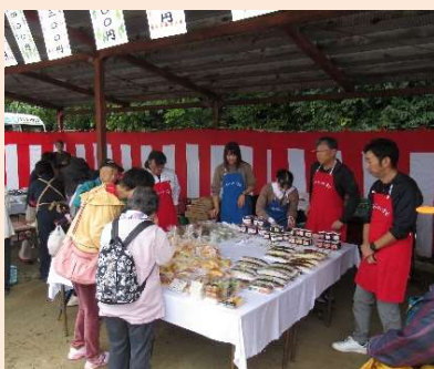
👉 ボランティアの方々による即売