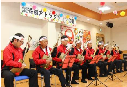
👉 星ヶ丘一座の皆様によるスコップ三味線

愛香祭を通して地域の方々との親睦も深まり、賑やかで楽しいひとときを過ごすことができましたこと、職員一同、心より御礼申し上げます。また、ご協力いただきました各種団体・ボランティアの方々のご協力、誠にありがとうございました。(上田 祥司)