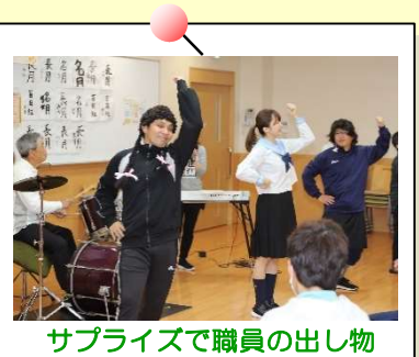
サプライズで職員の出し物 もあり、会場は大盛況☆