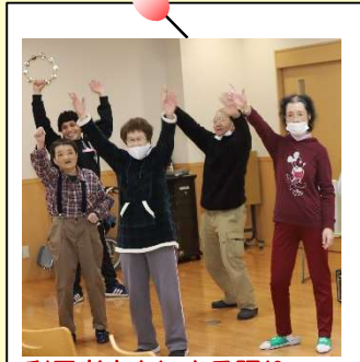
利用者さんによる踊りの お披露目♪