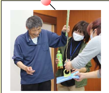
お目当ての品がやっと釣れて 最高の笑顔 (*~*)