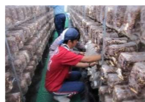
菌床椎茸の栽培・管理