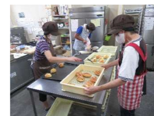
パンの製造・販売