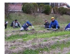
玉ねぎ苗の抜き取り