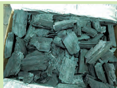
バーベキュー用木炭 10 kg