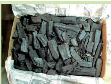
小炭入り木炭 10 kg