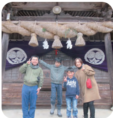
邑南町内の神社へ初詣