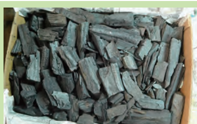
小炭入り木炭10kg 1,900円(税込)