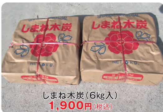
しまね木炭(6kg入) 1,900円(税込)