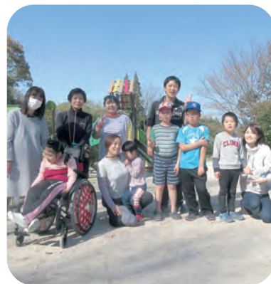
香木の森公園へお出かけ