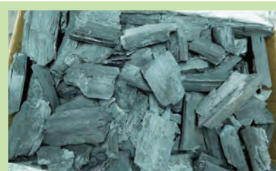
バーベキュー用木炭10kg 2,350円(税込)