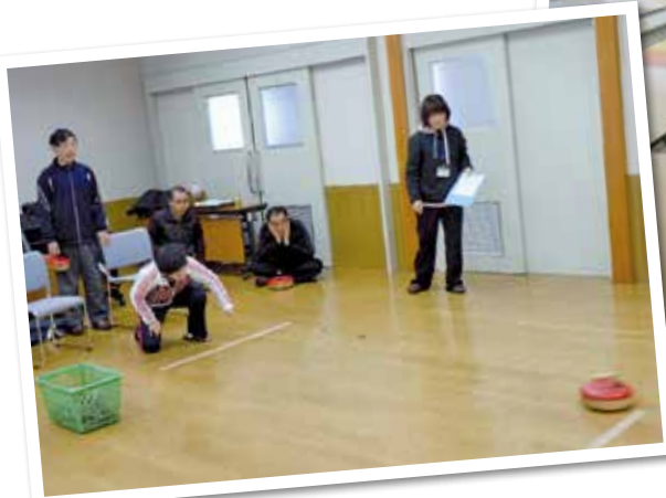
平成30年 社会参加事業 カローリング