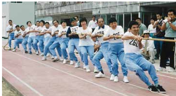
平成11年 全国知的障害者スポーツ大会