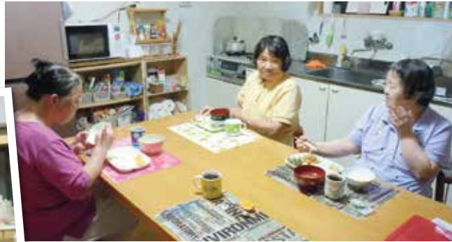
平成31年 明和寮 団らん