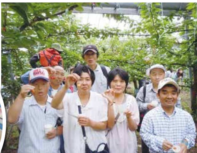
平成25年 休日のお出かけ「さくらんぼ狩り」