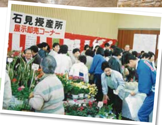
平成3年 愛香祭<展示即売コーナー>