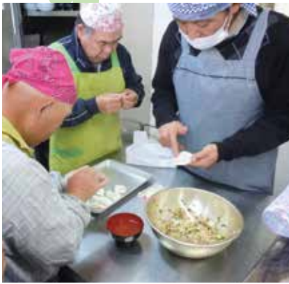
平成30年 障害者社会参加支援事業 料理教室