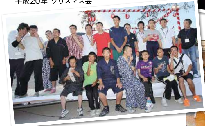
平成24年 四ツ葉の里夏祭り