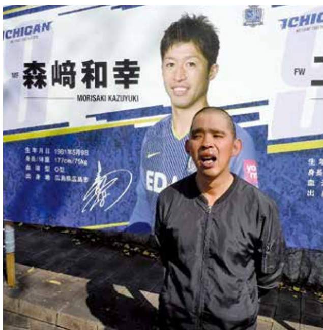
令和元年 初めてのサッカー観戦