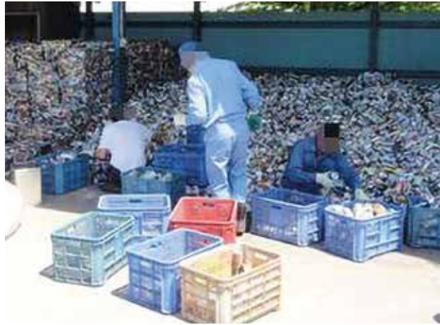
リサイクル班 (空き缶選別)