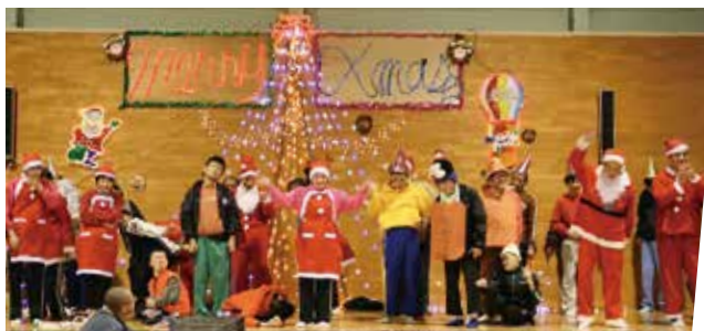
平成20年 クリスマス会