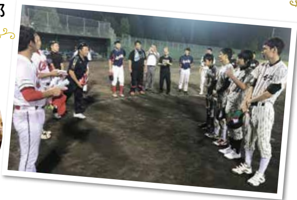
平成29年 邑南町障がい球児の親睦試合