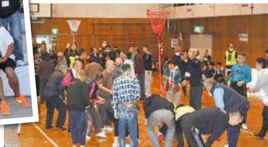
令和元年 親子ふれあいの日 (運動会)