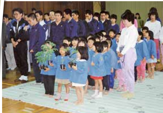
平成4年 野菜苗贈呈式