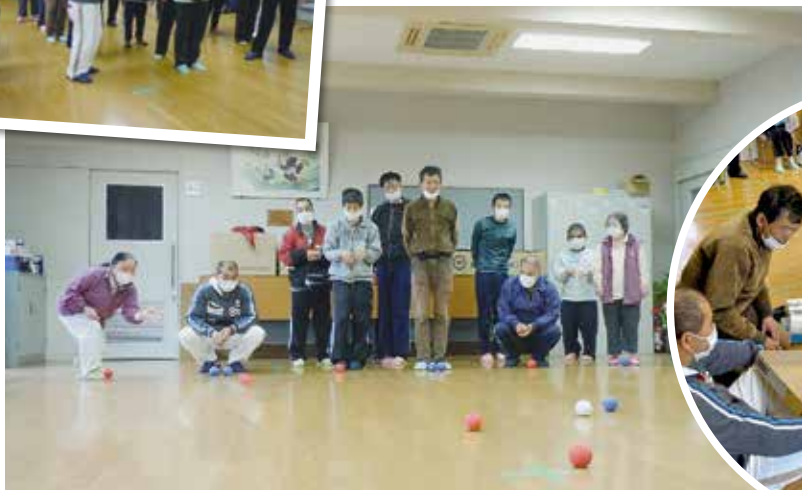
令和4年 お楽しみ会『白熱!ポッチャ大会』