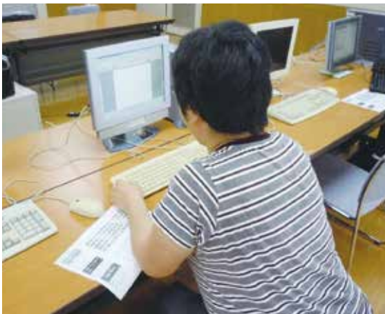
平成24年 障害者社会参加支援事業 パソコン教室