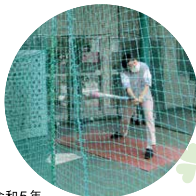
令和5年 バッティングセンターで豪速球に挑戦!