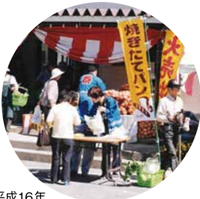
平成16年 四ツ葉の里記念ふれあいデイ