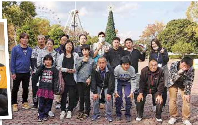
令和元年 親子遠足 (みろくの里)