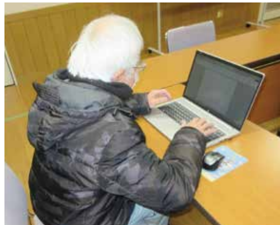
令和5年 障害者社会参加支援事業 パソコン教室