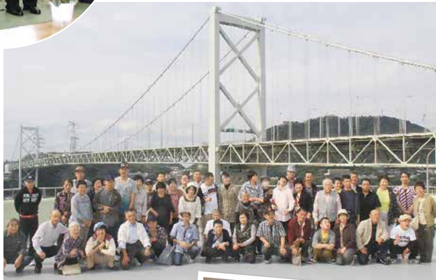
平成23年 親子旅行 (宿泊)