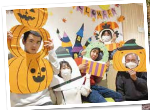
令和5年 ハロウィンパーティー