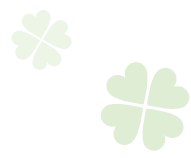
平成30年 障害者社会参加 支援事業 料理教室