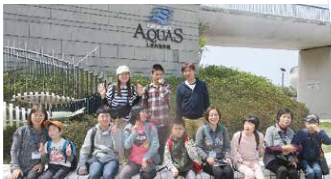
平成29年 園外活動 (アクアス)