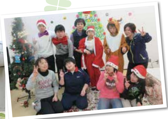
平成27年 クリスマス会