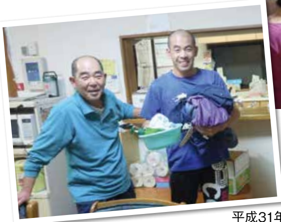
平成31年 春風荘 食卓の様子