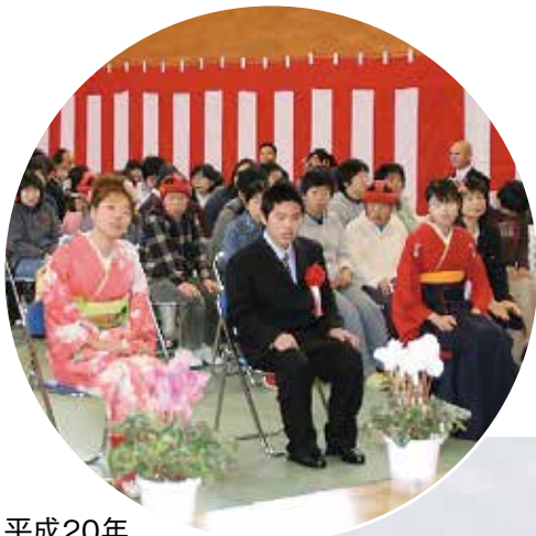
平成20年 二十歳を祝う会