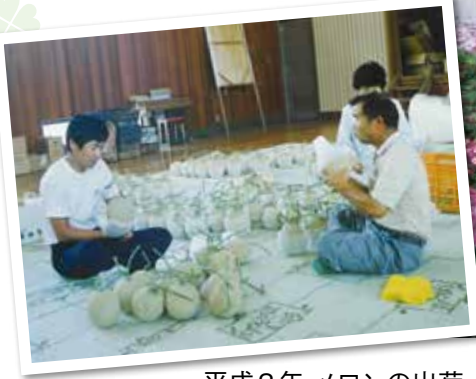
平成3年 メロンの出荷