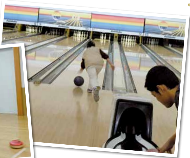
平成29年 社会参加事業 ボウリング