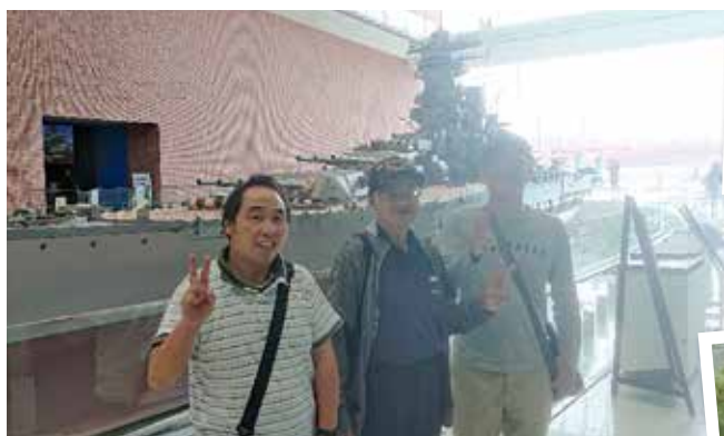
平成25年 広島県呉市の大和ミュージアム