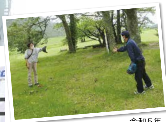
令和5年 大田市三瓶山でキャッチボール