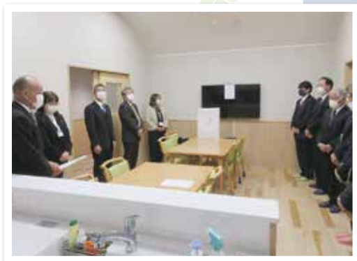
令和5年 ひなた竣工式