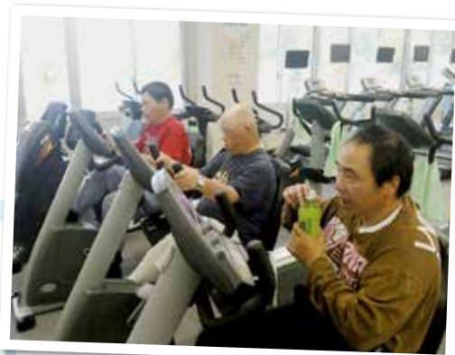
平成25年 元気館でトレーニング