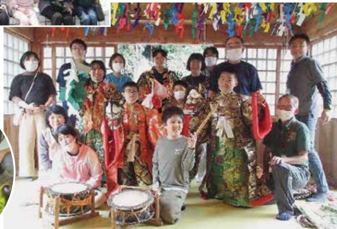
令和5年 地域交流 (中野大元神楽団)