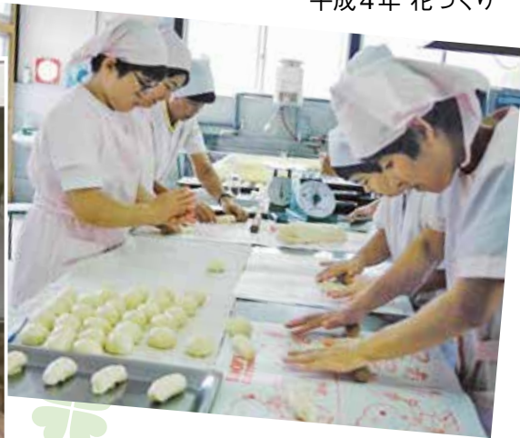
平成4年 パンの製造