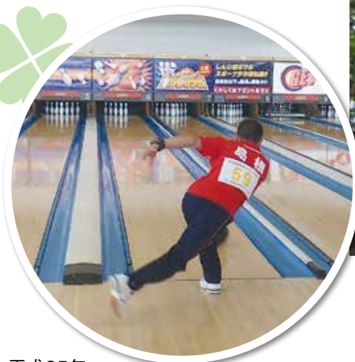
平成25年 障害者スポーツ大会ボウリングの部 「宍道湖ボウル」にて