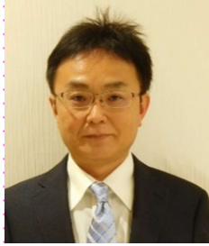
くるみ邑美園より異動 生活支援課 課長