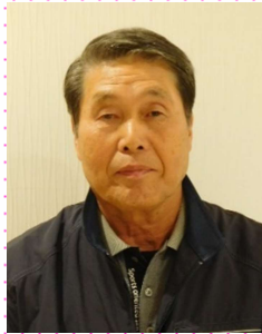
新規採用 生活支援員(生活介護事業)