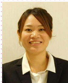
くるみ邑美園より異動 生活支援員(給食事業)