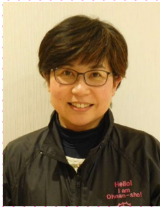
新規採用 生活支援員(生活訓練事業)