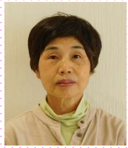
くるみ邑美園より異動 調理員