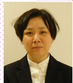
新規採用 生活支援員(生活介護事業)