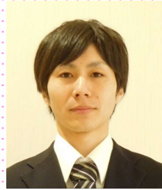
くるみ邑美園より異動 職業指導員(四葉ショップ 事業)