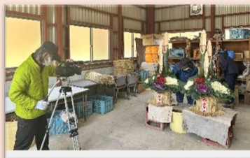
← テレビ局による 門松製作撮影の様子