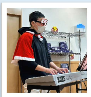
↓サンタクロース&オオナニショウ