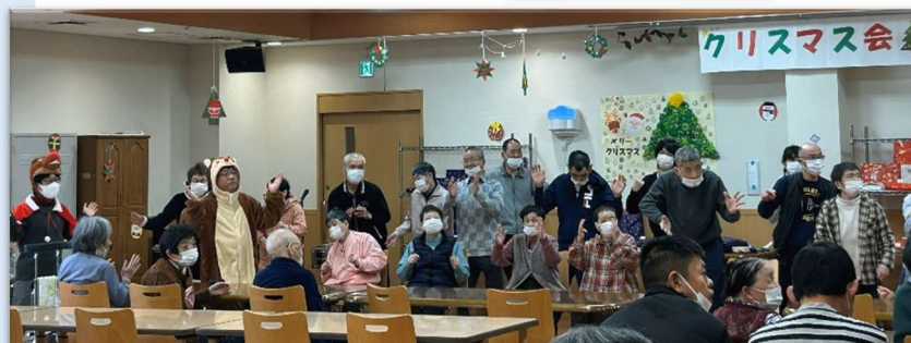
↑ご利用者様によるダンスの披露