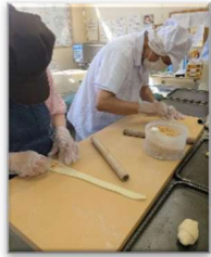
りんごロールを 成形しているところ